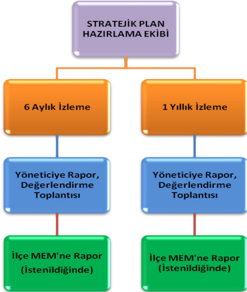
Şekil 2 İzleme ve Değerlendirme Süreci

Müdürlüğümüzün 2024-2028 Stratejik Planı İzleme ve Değerlendirme sürecini ifade eden İzleme ve Değerlendirme Modeli hazırlanmıştır. Müdürlüğümüzün Stratejik Plan İzleme- Değerlendirme çalışmaları eğitim-öğretim yılı çalışma takvimi de dikkate alınarak 6 aylık ve 1 yıllık sürelerde gerçekleştirilecektir. 6 aylık sürelerde Üst Yöneticiye rapor hazırlanacak ve değerlendirme toplantısı düzenlenecektir. İzleme-değerlendirme raporu, istenildiğinde Stratejik Geliştirme Başkanlığına gönderilecektir. Ayrıca ilimizin Mülki İdari Amirine sunulacaktır. 1 yıllık izleme-değerlendirme çalışmaları, Stratejik Planımızda yer alan hedeflerin yıllık düzeyde ifade edildiği Performans Programı ve yılsonunda gerçekleşme düzeylerinin belirlendiği Faaliyet Raporu hazırlanarak yapılacaktır. Performans Programı ve Faaliyet Raporu Üst Yöneticinin değerlendirmesinin akabinde Strateji Geliştirme Başkanlığına ve Mülki İdari Amire sunulacaktır. Yıllık izlemelerle ilgili değerlendirme toplantıları düzenlenecektir.